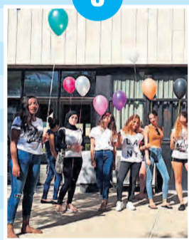
מפיצות אור בנות שירות לאומי