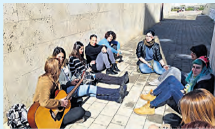
קשר בלתי אמצעי ומיומיוות הדרכה. פעילויות במרחב כ"ח

יום שלישי, 12:00 בצהריים, הבנות מתחילות להגיע. אנו שומעות אותן אט אט יורדות במדרגות למקלט. אנו מקבלות אותן בחיבוק גדול וניגשות יחד לפינת הקפה והכיבוד. יושבות בחוץ, מחליפות חוויות וסיפורים מהשבוע שעבר וכמובן מוסיפות תמונת סלפי נוספת לאלבום בנייד.