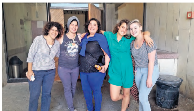
מעבירות את שרביט המנטורינג. עוצמה שקטה

שכל כך זקוק לו, בהקשבה, באהבה. מנטורינג זה הגדלה. הגדלה שלך בעיני עצמך, והגדלה של הלב שפועם בקרבך. פתאום הוא יכול להכיל כל כך הרבה סיפורים, ניגודים, כאבים ואחרי שהרחבנו אותו זה מה שמאפשר לנו כמנטוריות, גם להגדיל אחרים.