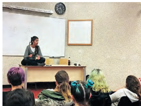
כדאי להירשם לשיעורים באוניברסיטה. שיעור תיאורטי בתוכנית

רוצות ללמוד מבוא לפסיכולוגיה, למשל? אוניברסיטה בעם היא הכתובת ונשמח לעזור לכן להשתלב • הירשמו, הירשמו!