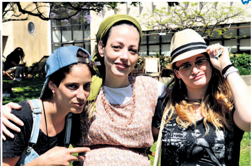
חגיגה נשית. יריד בוגרות