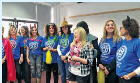
תחילתו של מסע ארוך. מעגל נשים פורים

פשוט להיות במרחב הכ"ח, לקבל תשובה אמיתית לשאלה "מה שלומך?", או להיטיב עם הנערות שמגיעות • נשות צוות ומתנדבות מספרות על המפגש עם בנות המנטורינג