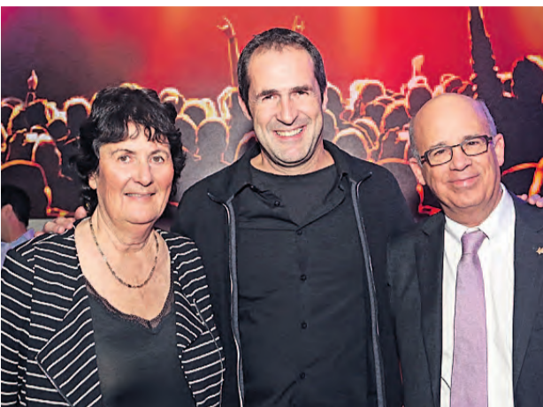
ערב התרמה שארגנה אגודת היידיים לתוכנית המנטורינג

ועם הפנים קדימה, להמשך הרחבה, העמקה ופיתוח של כל אחת ואחת מכן ושל התוכנית בכללותה, בהצלחה רבה.