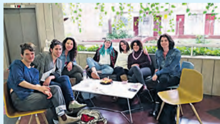
לא מאמינות שהשנה הסתיימה. צוות כ"ח

חממת הגראז' נתנה לי להביע את עצמי מכל הכיוונים. עשיתי אמנות מיוסרת ועשיתי אמנות מאושרת!