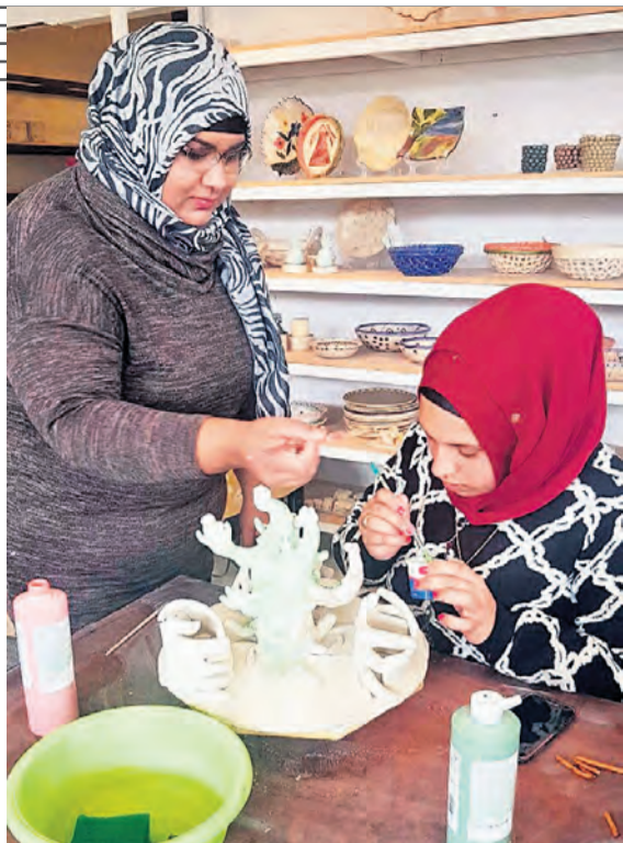
מסע עם אמונה. קבוצת אום אל פחם