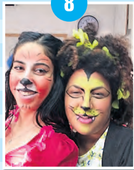
מפיצות שמחה מנטוריות בפורים