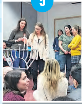
מציירות מעגלים של חום ואהבה