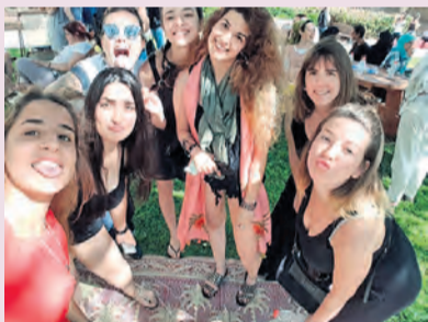
הרגעים הקטנים שיוצרים יחד. בנות שירות לאומי

"לא יהיה ניצחון לאור על החושך כל עוד לא נעמוד על האמת הפשוטה שבמקום להילחם בחושך עלינו להגביר את האור" א.ד גורדון