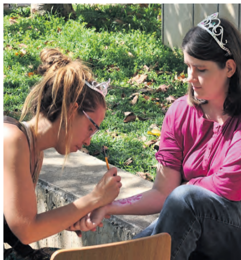
תודה על חיוך, מילה טובה וחיבוק. יריד בוגרות