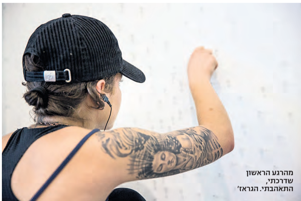
מהרגע הראשון שדרכתי, התאהבתי. הגראז'

אמנות פלסטית, מוזיקה וגם כתיבה הן דרכים להתמודד עם נפש רגישה • בחממת הגראז' בתל אביב עושים אמנות שעוזרת לשנות את החיים